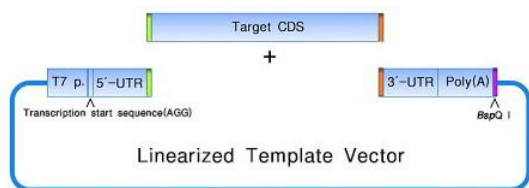
图 1. 基于 In-Fusion 无缝克隆构建 IVT 模板质粒